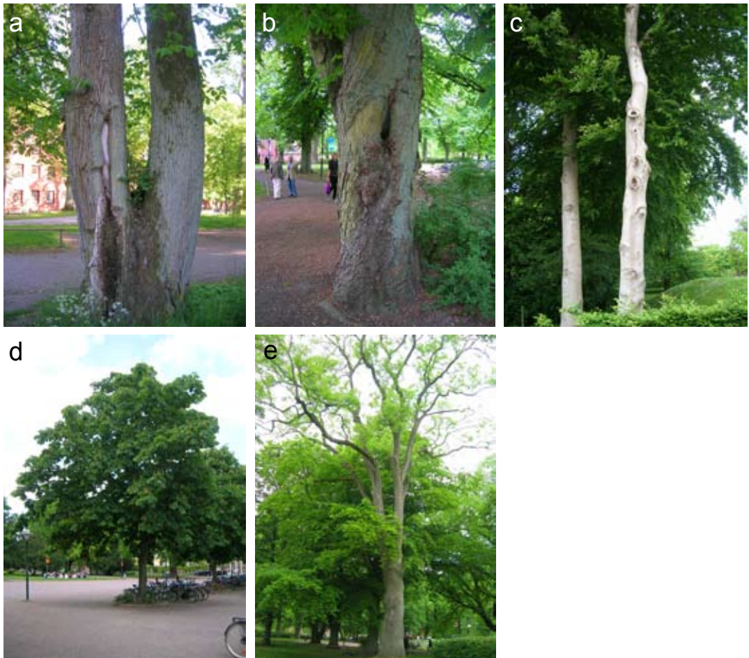
Figur 1. Träd av a) klass I-typ, b) Klass II-typ, c) Klass III-typ, d) Klass IV-typ och e) klass R-typ. a) En alm i UB-parken i Lund med stort savflöde och medelstort barklöst parti (nr. 118 i Fig. 2). Här hittades t.ex. Nosodendron fasciculare (Oliv.), Prionocyphon serricornis (Müll.), Quedius truncicola F. & L., Phloeophagus thomsoni (Grill), Trinodes hirtus (F.), Brachyopa insensilis Coll., Mallota cimbiciformis (Fall.) och Aulacigaster leucopez (Meig.); – b) Hästkastanj i UB-parken i Lund med stort, vattenfyllt grenhål (nr. 61 i Fig.2) där bl.a. Prionocyphon serricornis är vanlig; – c) Bok vid en bilparkering i utkanten av Tunaparken i Lund med begynnande stamhåligheter och flera små grenhål. Här kan man förvänta sig Prionychus ater (F.) Mycetochara linearis (Ill.) och andra vanliga hålträdsarter; – d) Hästkastanj av yngre årsklass i Lunda gård, Lund som saknar rödlistade vedinsekter; – e) Mogen och till synes frisk och oskadad ask i UB-parken i Lund. Trädet ser instabilt ut och kommer sannolikt snart att knäckas i någon storm. En viktig framtida resurs för vedinsekter.

Examples of trees of a) class I, b) class II, c) class III, d) class IV and e) class R (= resource). – a) Mature Ulmus glabra with large sap-run and moderate-sized area of exposed wood. Typical saproxylic species are Nosodendron fasciculare (Oliv.), Prionocyphon serricornis (Müll.), Quedius truncicola F.&L., Phloeophagus thomsoni (Grill), Trinodes hirtus (F.), Brachyopa insensilis Coll., Mallota cimbiciformis (Fall.) and Aulacigaster leucopez (Meig.). – b) Mature Aesculus hippocastani with large water-filled rot-hole. Plenty of larvae of Prionocyphon serricornis present. – c) Fagus sylvatica with shallow rot-holes. Common saproxylics like Prionychus ater (F.) and Mycetochara linearis (Ill.) may be expected to occur. – d) Young Aesculus hippocastani in. Redlisted insects are absent. – e) Mature, healthy Fraxinus excelsior in Lunda gård, for the moment lacking decaying wood but expected to develop such within 20-100 years from now. These kinds of 'resource trees' are extremely important as a future resource for redlisted saproxylic insects.